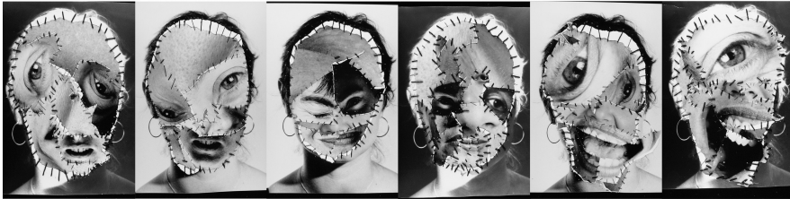
Annegret Soltau, In mir SELBST, 1977, Fotovernähung, 12 Werke, Rahmenmaß je 65 x 54 cm