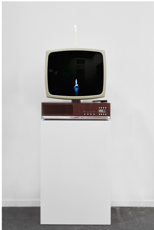
MEDIA MAY REWIND REALITY | 1970/2023 | 1-Kanal Videoinstallation 8h Loop | Edition: Nr. 2/3 + 1 AP